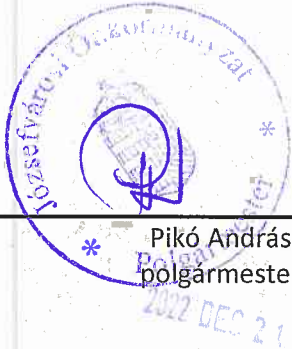
Pikó András polgármester

Budapest Főváros VIII. Kerület Józsefvárosi Önkormányzat képviselőjében: