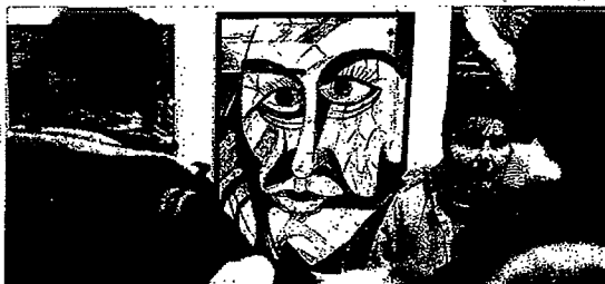
Festészet a maratonon a Darvas Képkeretben. Képek a saját készítésű műveikről, nem hivatalos személyes magánműveikről.

Az intézményi keretek között hosszabbban kezelte pszichiátriai betegek tíz-tizenöt százaléka spontán elkészült alkotásait, közülük néhányan kiemelkedő művészi szintre jutnak. A festészet renek terépin, az art brut, a készletek nyers, őszinte művészetek ki is lépnek a kórházak kapuján. A huszonnégy órás festőmaratonot követően mindenki láthatja legjobb sikerült képeiket.