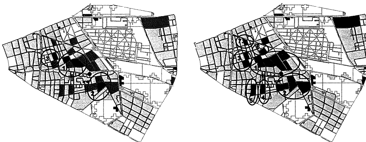
4. ábra: A 2011-es népszámlálási adatok alapján előállított szegregációs mutató által lehatárolt szegregátumok és veszélyeztetett területek.

A 2011. évi népszámlálási adatok alapján Budapest VIII. kerületében három városszövetbe ágyazott szegregátum (bekarikázott sötétzöld), ezek körül bővebb, szegregációval veszélyeztetett kapcsolódó területek (bekarikázott sötétlila), illetve négy további szegregációval veszélyeztetett terület (szintén bekarikázott sötétlila) található. Utóbbiak közül kettő – a 4-es és 5-ös jelű – esetében tudható, hogy a Corvin Sétány Program előrehaladása nyomán veszélyeztetettségük időközben bizonyosan megszűnt, további értékelésük nem szükséges.