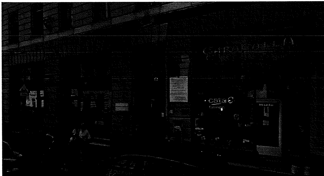
emléktábla tervezett helye