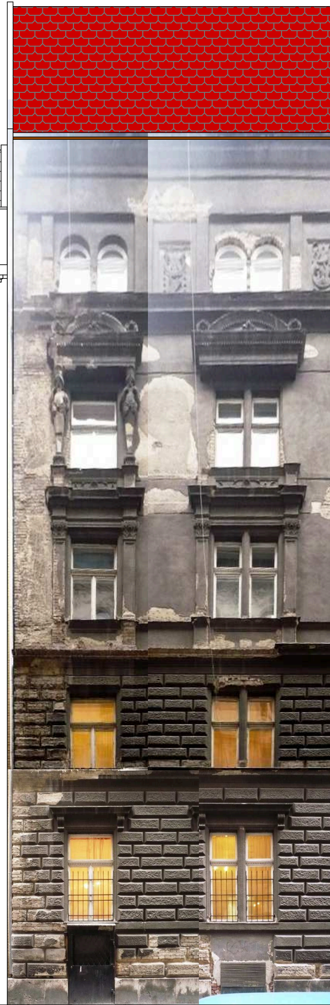
UT1 JELŰ HOMLOKZAT felület 764,0 m 2