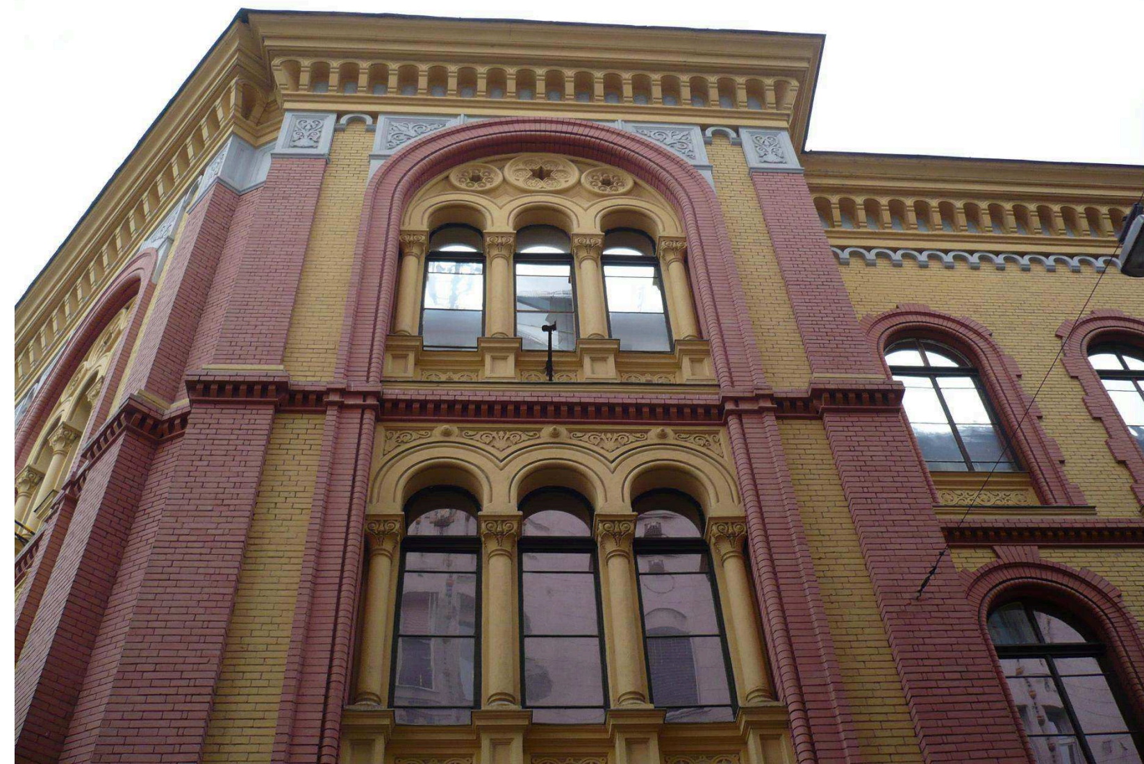
SCHEIBER SÁNDOR UTCA