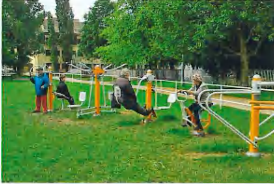
Harrer Pál utca

Budapest számos kerületében működnek már közösségi szabadidős sportparkok ilyen, általunk is telepíteni kívánt eszközökkel. A lakosság részéről valamennyi esetben pozitív visszajelzés érkezett az önkormányzatok felé.