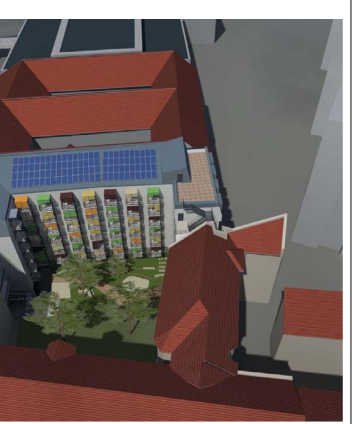
DK-I NÉZET - MADÁRTÁVLAT