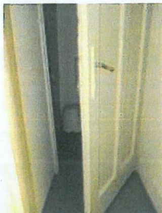
09. közlekedő – beltéri ajtó