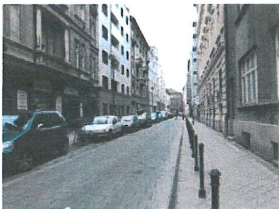
03. Kőfaragó utca