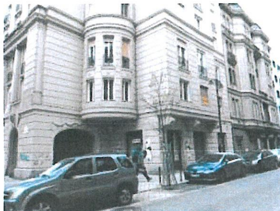
02. épület utcai homlokzata