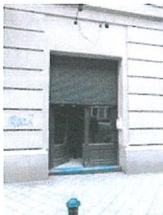
04. üzlethelyiség bejárata