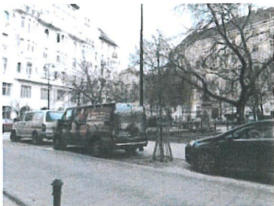
01. Gutenberg tér

ingatlanerteke.hu tunde.leveleki@ingatlanerteke.hu