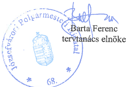
Barta Ferenc tervtanács elnöke