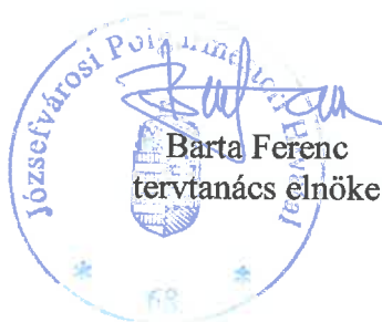
Barta Ferenc tervtanács elnöke