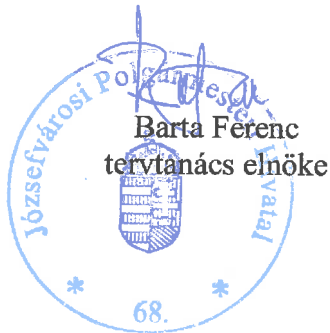
Barta Ferenc tervtanács elnöke