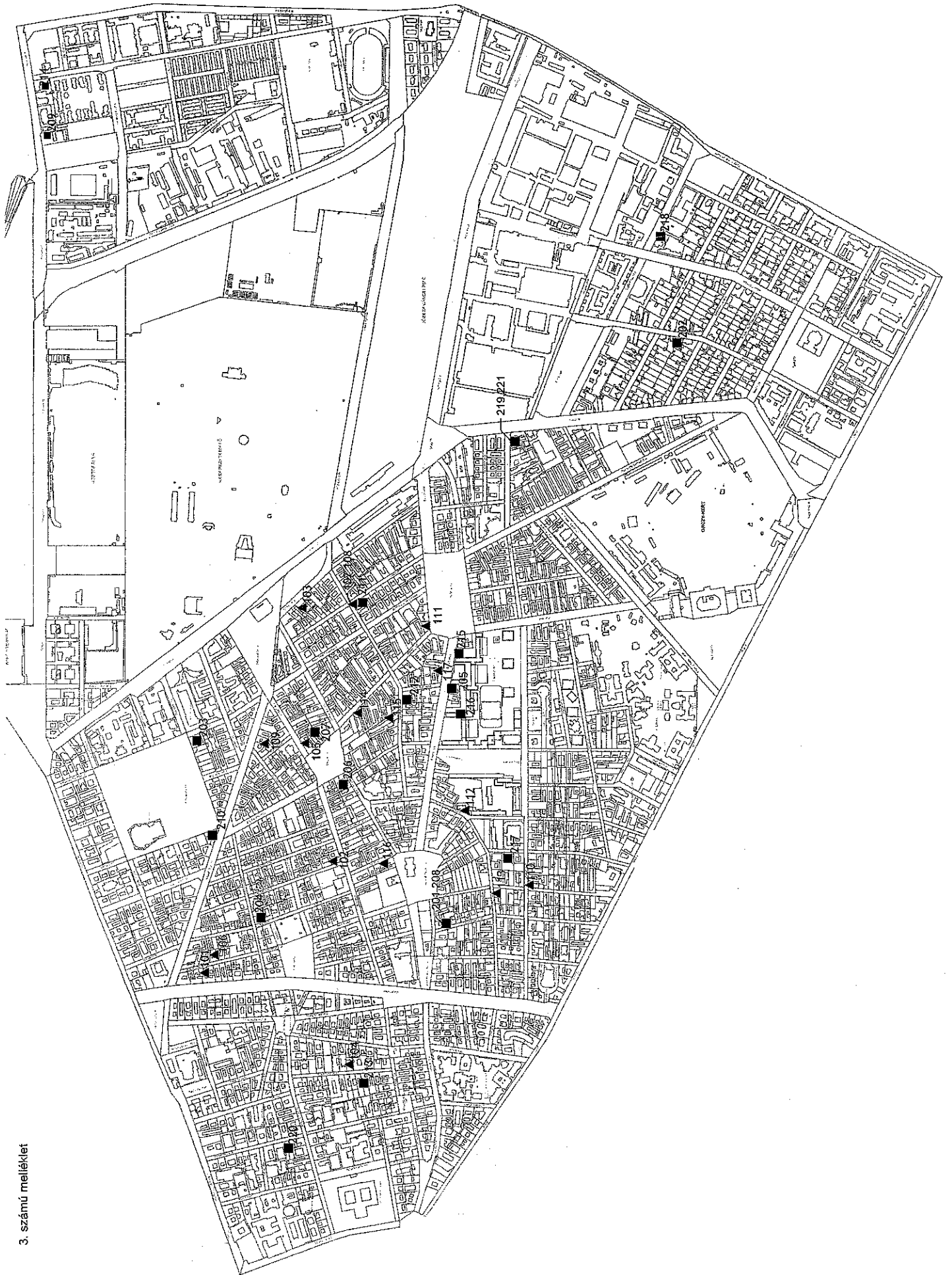
3. számú melléklet