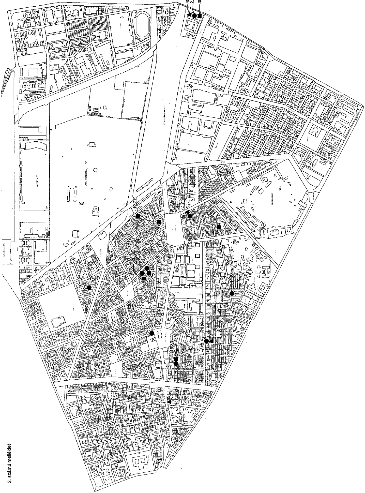
2. számú melléklet