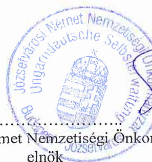
Józsefvárosi Német Nemzetiségi Önkormányzat elnök