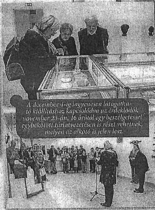
A december 4-ig ingyenesen látogatható kiállításához kapcsolódva az érdeklődők november 23-án, 16 órától egy beszélgetessel egybekötött tárlatvezetésen is részt vehetnek, melyen az alkotó is jelen lesz.