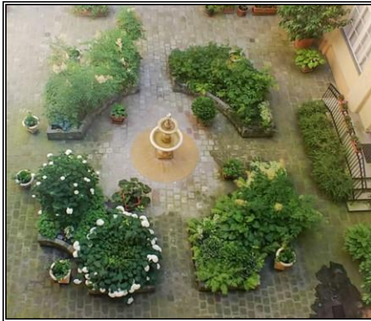
1. ábra Példa a pályázat megvalósítására „A” modul: Zöld udvar (forrás: https://budapest.hu/Documents/ZOLDINFRASTRUKTURA_FUZEIEK_belsoudvarok_20191018_online.pdf )

A pályázat kiírásánál és megvalósításánál a Budapest Főváros Főpolgármesteri Hivatal által kiadott, Belvárosi belső udvarok megújítása, Zöldinfrastruktúra füzetek 5. című kiadványában leírtakat vettük figyelembe és az ott javasolt megoldásokat részesítjük előnyben az elbírálás során.