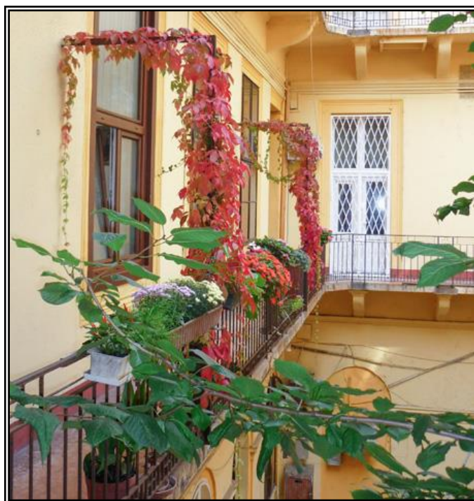
4. ábra: Példa a pályázat megvalósítására „D” modul: Gangzöldítés