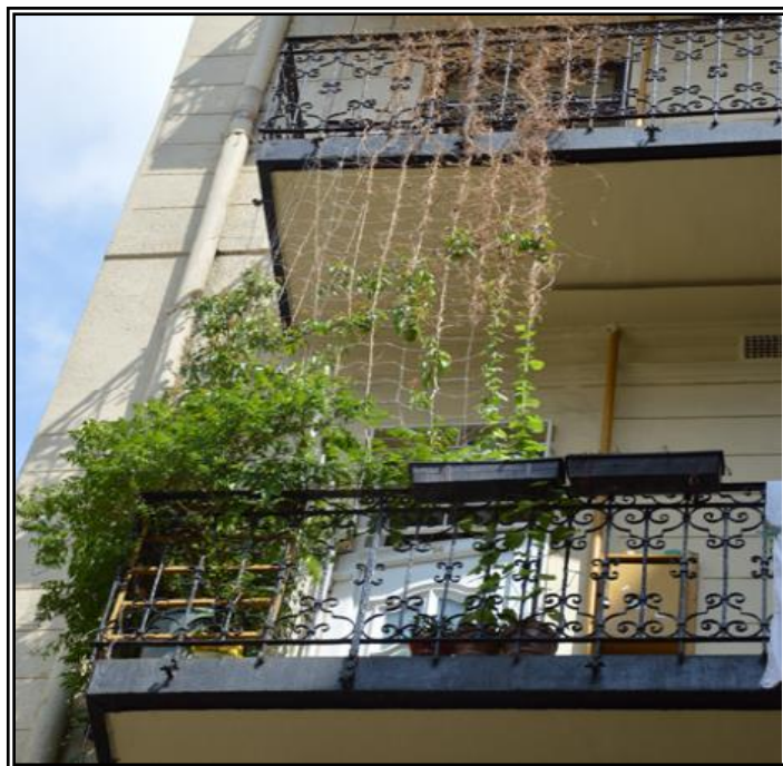
2. ábra: Példa a pályázat megvalósítására „B” modul: Árnyékolás