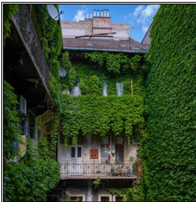
3. ábra Példa a pályázat megvalósítására „C” modul: Homlokzatzöldítés