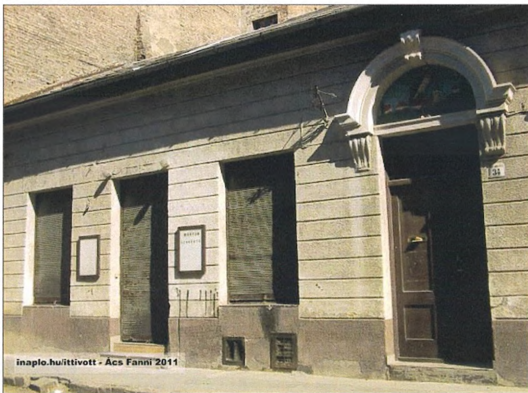
5. kép. Az épület homlokzata 2011-ben