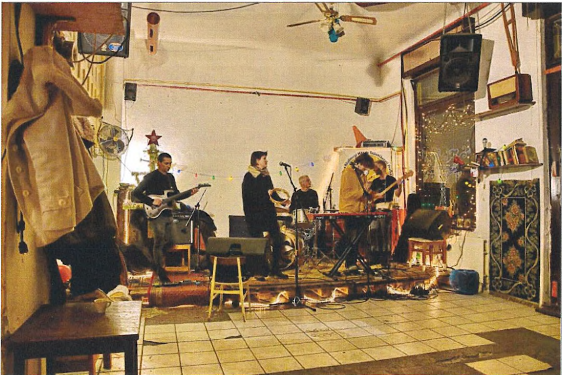
10. kép. Koncert a Gólyában