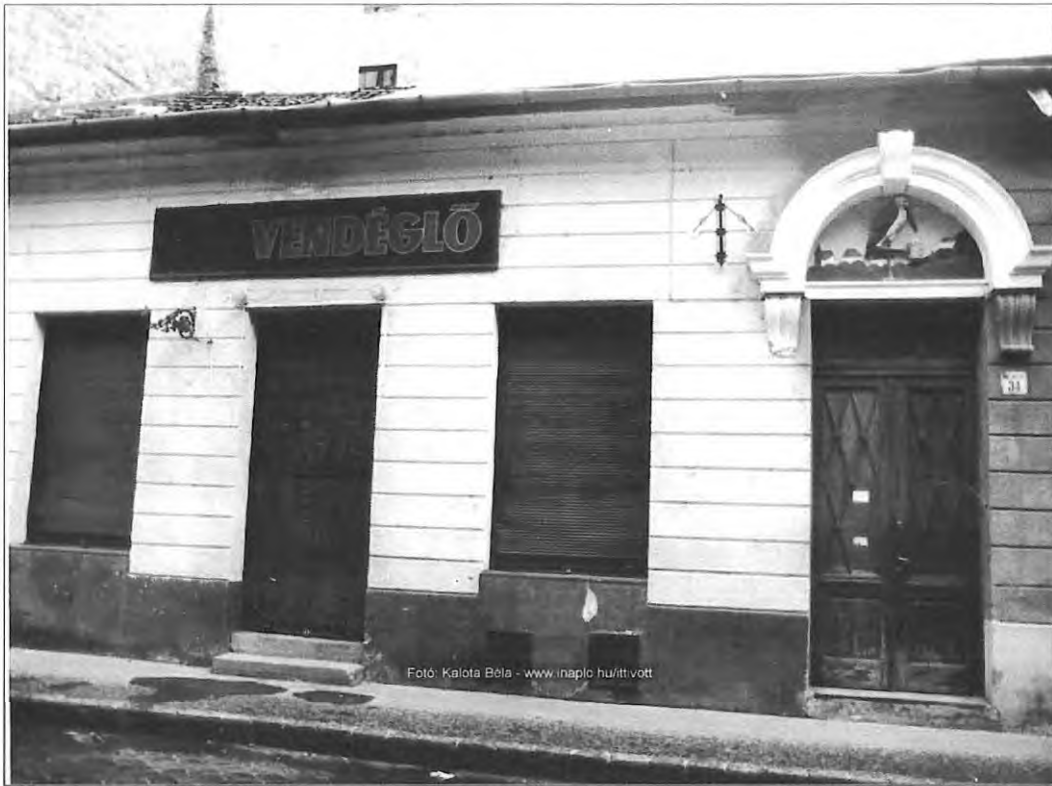
4. kép. Az épület homlokzata az egykori vendéglő táblájával