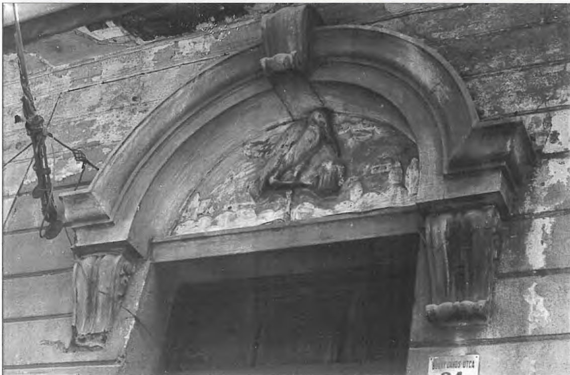
3. kép. A golya ábrázolású dombormű a bejárati kapu felett