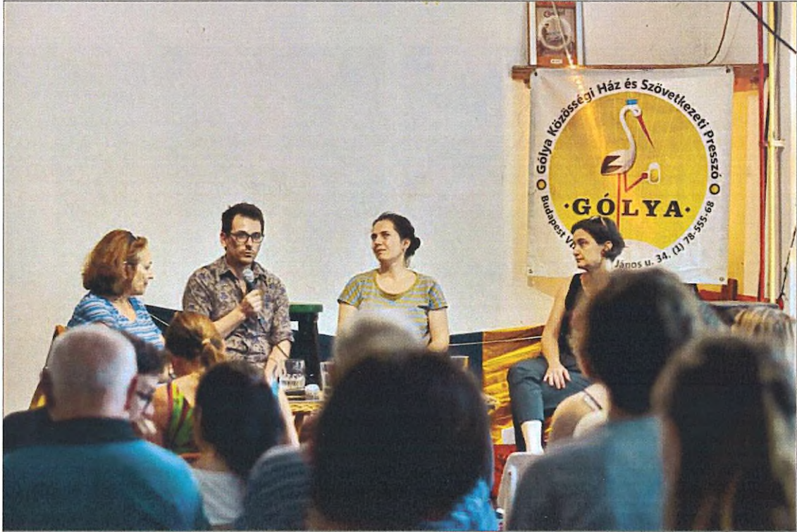
9. kép. Pódiumbeszélgetés a Gólyában