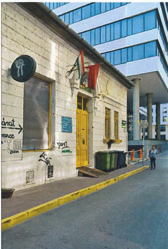
6. kép. A homlokzat déli része a Bókay János utca 32. sz. részletével