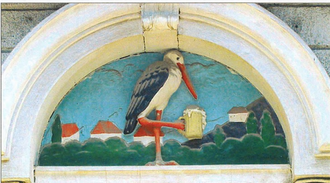
8. kép. A kapubejáró feletti, az épület eredeti funkciójára és az egykori utcanevre is utaló stukkó