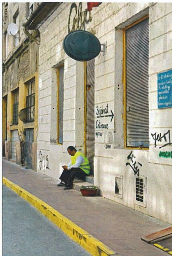
7. kép. A homlokzat északi része a Bókay János utca 36. sz. részletével