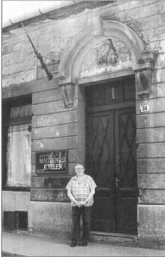
1. kép. Bejárati kapu