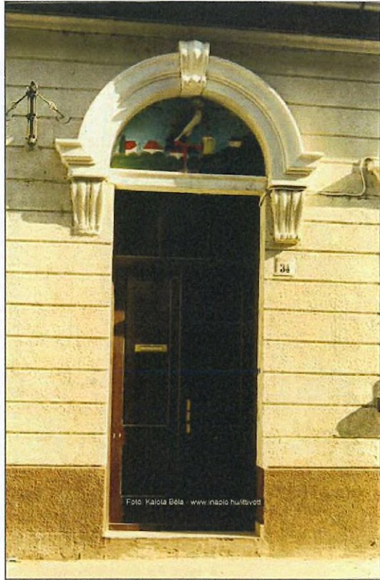
2. kép. Bejárati kapu