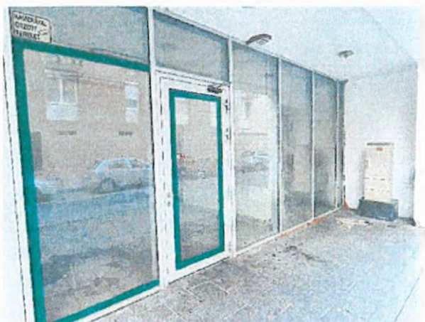
04. ingatlan utcafronti bejárata