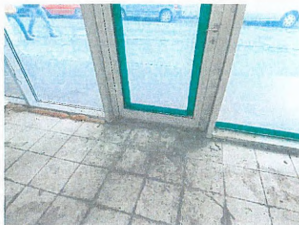
05. ingatlan bejárata az utca felől