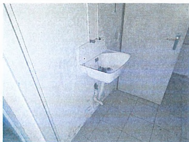
09. vízvételi lehetőség (raktár + előtér)