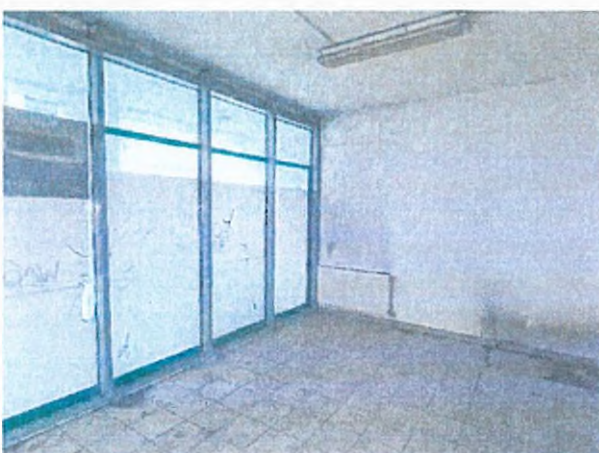
08. padozat, falszerkezet