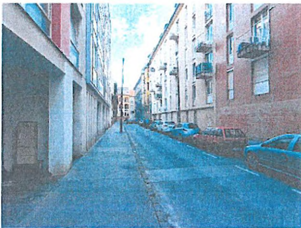
01. ingatlan környezete (Lovassy László utca)