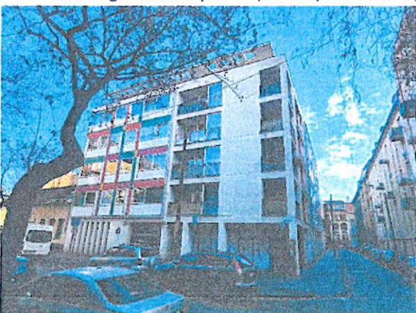
03. utcafronti homlokzat