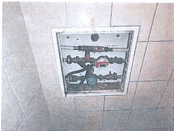
12. vízóra, hőmennyiségmérő