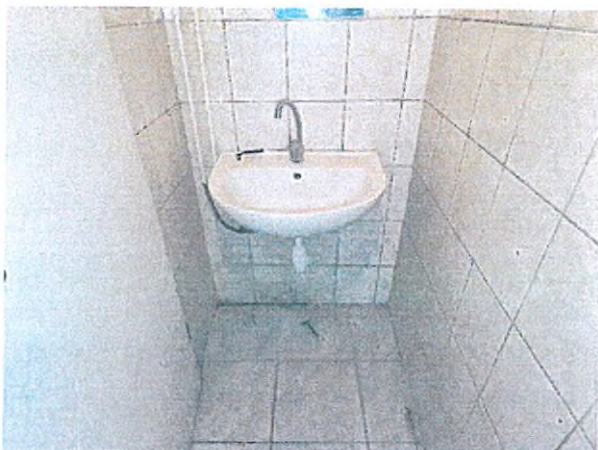
10. vízvételi lehetőség (mosdó)