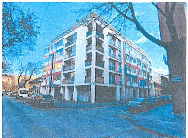
02. utcafronti homlokzat