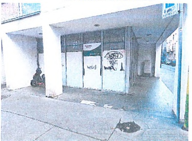
02. utcafronti lábazat