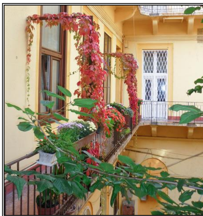
4. ábra: Példa a pályázat megvalósítására „D” modul: Gangzöldítés