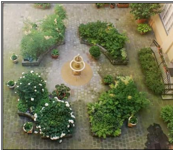
1. ábra Példa a pályázat megvalósítására „A” modul: Zöld udvar

A pályázat kiírásánál és megvalósításánál a Budapest Főváros Főpolgármesteri Hivatal által kiadott, Belvárosi belső udvarok megújítása, Zöldinfrastruktúra füzetek 5. című kiadványában leírtakat vettük figyelembe és az ott javasolt megoldásokat részesítjük előnyben az elbírálás során.