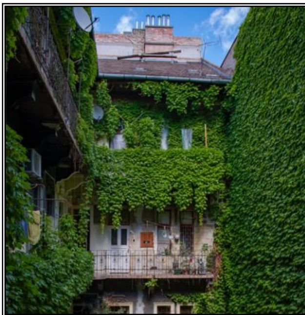
3. ábra Példa a pályázat megvalósítására „C” modul: Homlokzat zöldítés