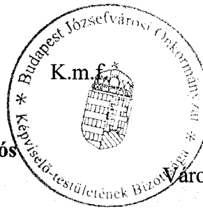
Könczöl Dávid Városüzemeltetési Bizottság alelnöke