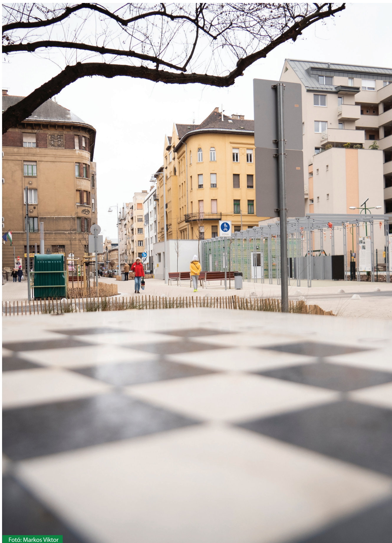
Fotó: Markos Viktor