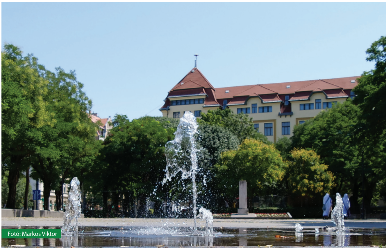
Fotó: Markos Viktor