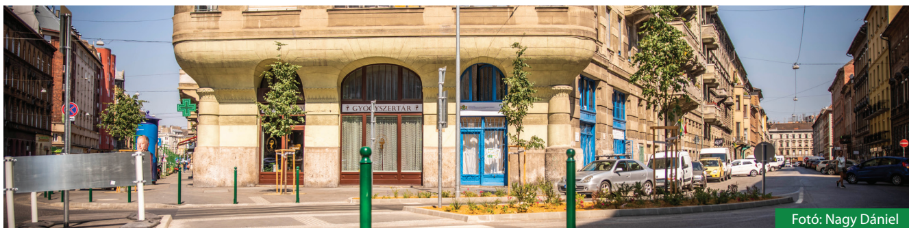
Fotó: Nagy Dániel