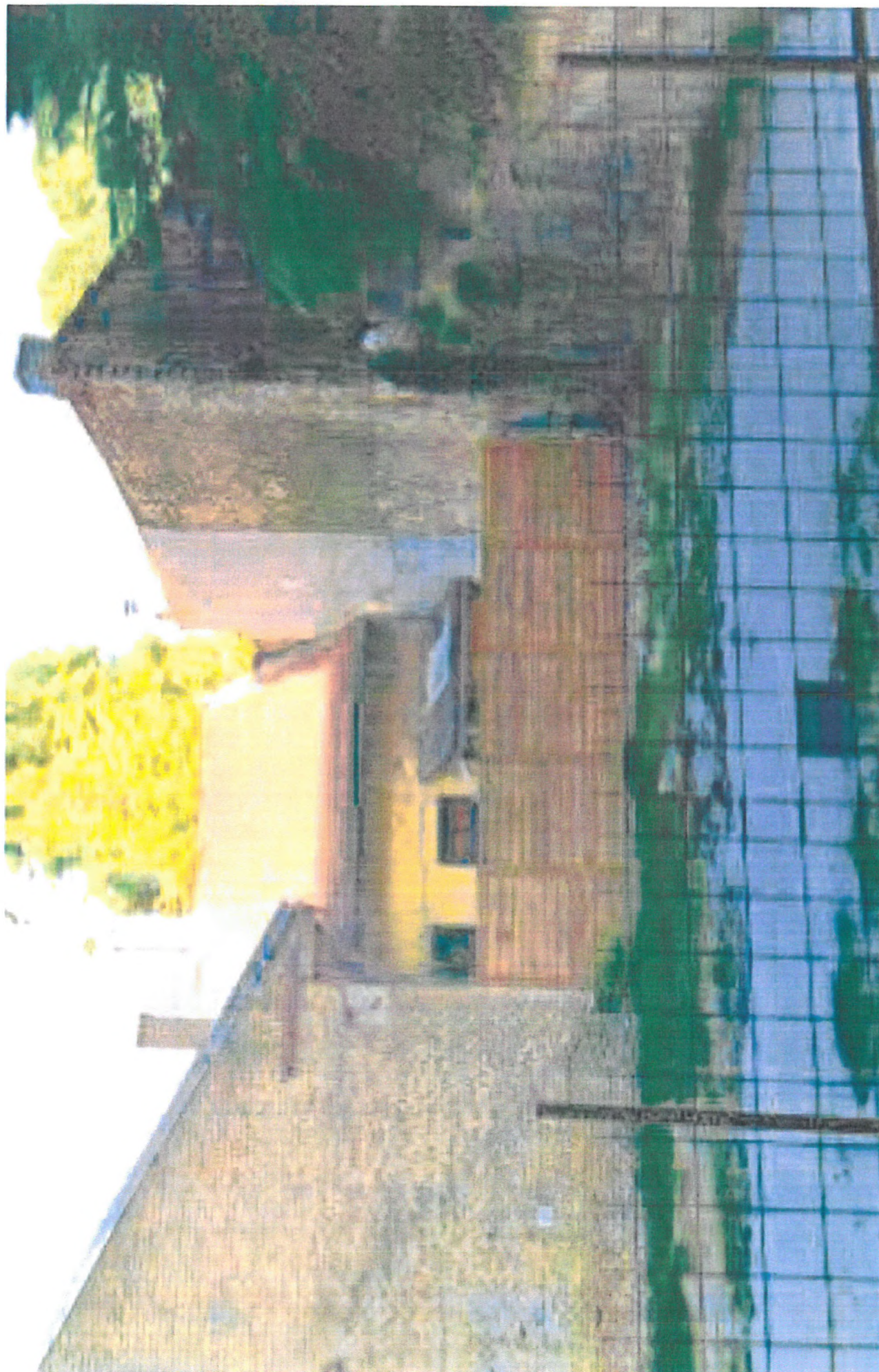
Magdolna utca 13. sz. telek felé eső fakerítés