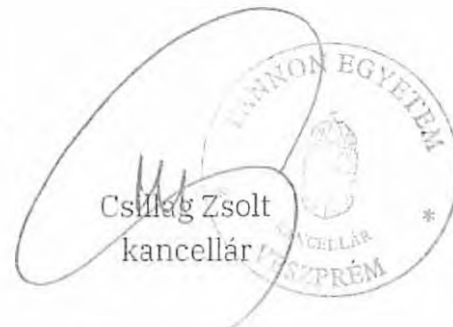
Csillag Zsolt kancellár