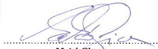
Makó Gina Megbízott

Pénzügyi fedezete a Józsefvárosi Roma Önkormányzat 67/2024 (VII.24.) számú határozatában foglaltak szerint. 69/2024 (VII.24.) számú határozatában foglaltak szerint. 71/2024 (VII.24.) számú határozatában foglaltak szerint. 73/2024 (VII.24.) számú határozatában foglaltak szerint.