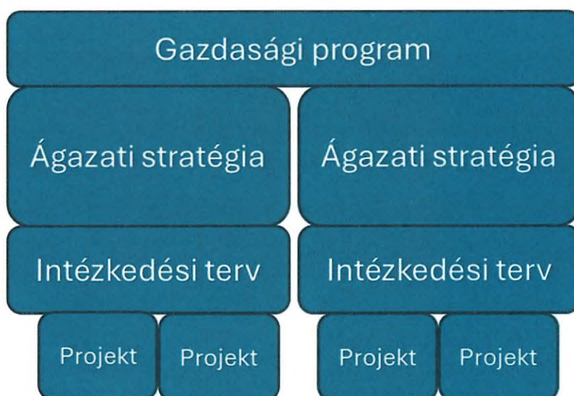
1. ábra A gazdasági program helye a stratégiai irányítási környezetben

A Józsefvárosi Önkormányzat Gazdasági Programjának elsődleges célja, hogy politikai állításokat és szakpolitikai sarokköveket fogalmazzon meg, amelyek a kerület gazdasági és társadalmi fejlődését egyaránt szolgálják, összhangban Pikó András polgármester 2024-es választási programjával. Ez a dokumentum nem alkotja újra az önkormányzat stratégiai horizontját, hanem az eddig elfogadott ágazati stratégiákra épül, amelyek továbbra is érvényben maradnak felülvizsgálati dátumukig. Az ágazati stratégiák, mint például az Integrált Településfejlesztési Stratégia, a Klímastratégia, a Gazdaságfejlesztési Stratégia, a Turizmusfejlesztési Stratégia, a Helyi Esélyegyenlőségi Program és a Józsefvárosi Esélyegyenlőségi Program biztosítják a kerület hosszú távú fejlesztési kereteit. Jelen gazdasági program ezekre támaszkodik, kiegészítve azokat a polgármester programjából fakadó irányelvekkel, amelyek a gazdasági stabilitás mellett a társadalmi egyenlőség és kohézió előmozdítására is fókuszálnak.