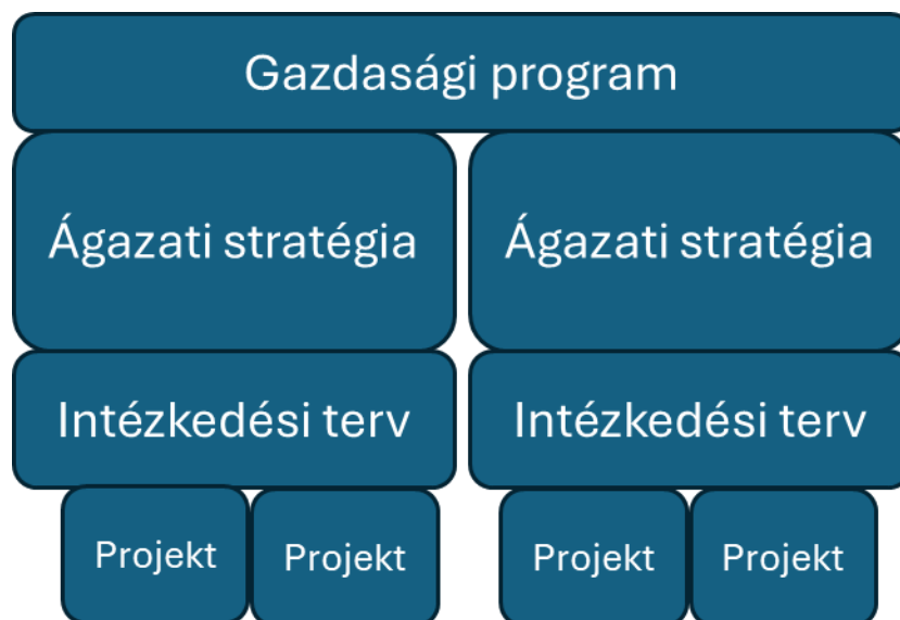
1. ábra A gazdasági program helye a stratégiai irányítási környezetben

A Józsefvárosi Önkormányzat Gazdasági Programjának elsődleges célja, hogy politikai állításokat és szakpolitikai sarokköveket fogalmazzon meg, amelyek a kerület gazdasági és társadalmi fejlődését egyaránt szolgálják, összhangban Pikó András polgármester 2024-es választási programjával. Ez a dokumentum nem alkotja újra az önkormányzat stratégiai horizontját, hanem az eddig elfogadott ágazati stratégiákra épül, amelyek továbbra is érvényben maradnak felülvizsgálati dátumukig. Az ágazati stratégiák, mint például az Integrált Településfejlesztési Stratégia, a Klímastratégia, a Gazdaságfejlesztési Stratégia, a Turizmusfejlesztési Stratégia, a Helyi Esélyegyenlőségi Program és a Józsefvárosi Esélyegyenlőségi Program biztosítják a kerület hosszú távú fejlesztési kereteit. Jelen gazdasági program ezekre támaszkodik, kiegészítve azokat a polgármester programjából fakadó irányelvekkel, amelyek a gazdasági stabilitás mellett a társadalmi egyenlőség és kohézió előmozdítására is fókuszálnak.