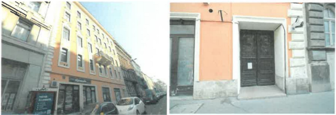
Társasház utcai homlokzata