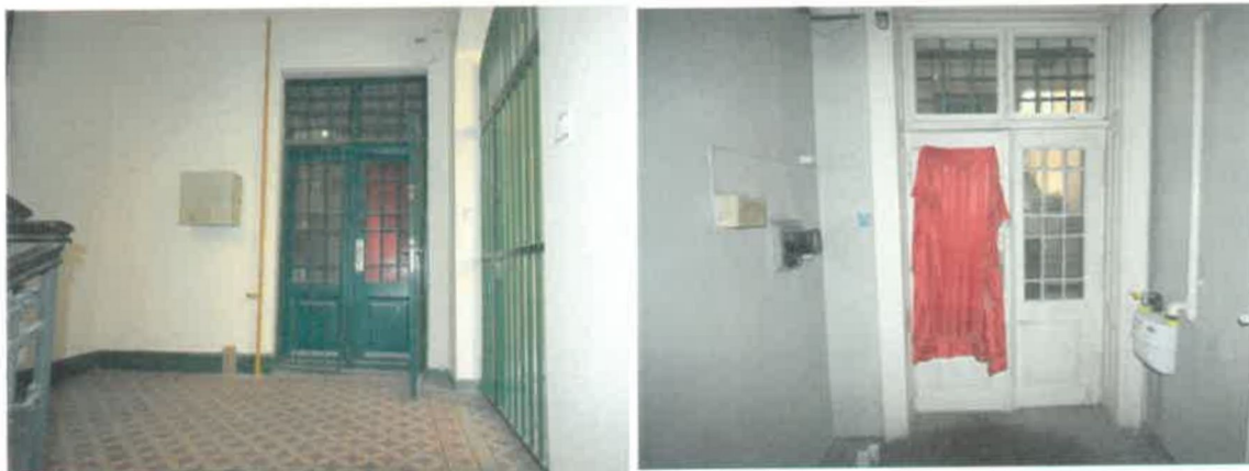
Vizsgált ingatlan bejárata

1085 Budapest, Üllői út 18. II. emelet 13. lakás (Hrsz.: 36764/0/A/19)