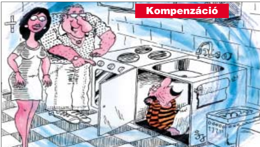
- Felvettem egy kisnyugdíjast konyhamalacnak