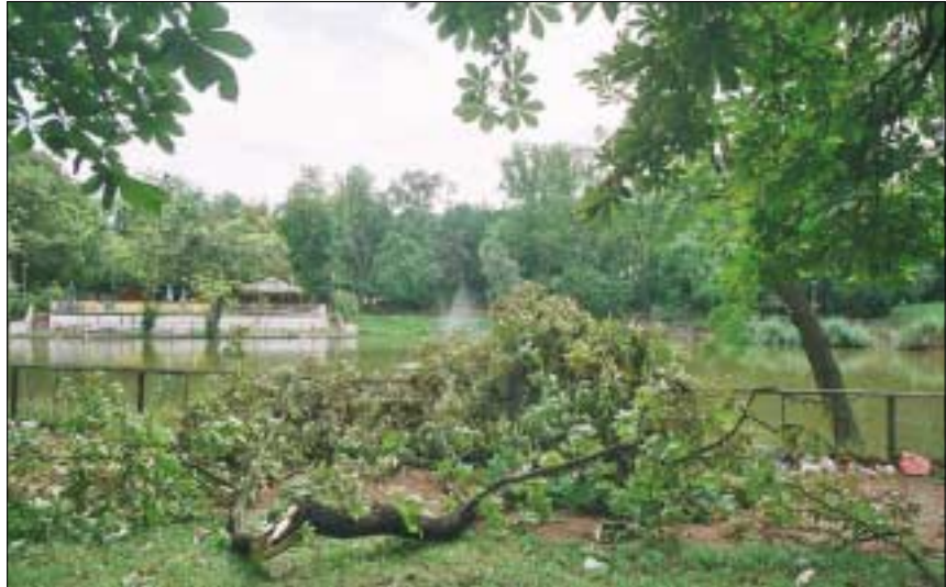
A vihar az Orczy-kertben is óriási pusztítást végzett

A rendvédelmi szervezet és intézményeket a legnagyobb szakmai elismerés illeti a vihar után közvetlenül, illetve a rá következő napokban kifejtett tevékenységük