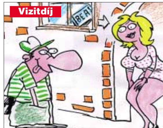
-Nálam csak tizedannyi lesz, mint amennyit az SZTK-ban fizetsz, szívi...

A rendezvény kiemelt támogatója idén a RÉV8 Rt. És a Józsefvárosi Önkormányzat, a Gyermekjóléti Szolgálat és az Ébredések Alapítvány. Minden program a hagyományoknak megfelelően ingyenes! kb