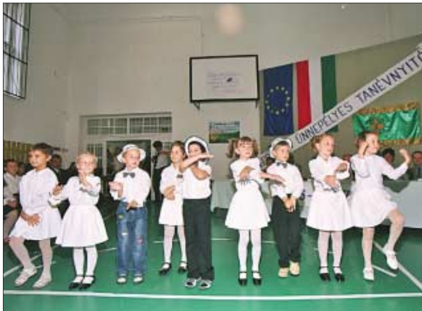
A hivatalos tanévnyitóra a Mesepalota Óvoda ovisai is műsorral készültek