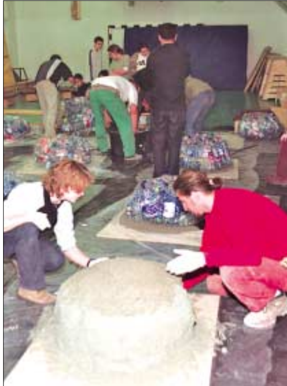
PET PALACKOKBÓL KÉSZÜLNEK UTCAI BÚTOROK A MÁTYÁS TÉRRE. A magyar találmányt a Rév8 Rt. támogatásával egyetemisták mutatták be az Erdélyi utcai iskolában