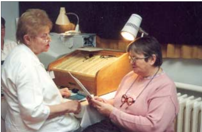
A vizitdíjak pénzéből azt az adminisztrátort lehet kifizetni, aki könyveli a bevételt

hét felnőtt háziorvosi rendelőben 47 háziorvos dolgozik. Az elmúlt évben a szakrendelőkben több mint 400 ezer beteg jelent meg. A beavatkozások száma elborzasztó, hiszen több mint kétmillió esetről van szó. Az „lent” Józsefvárosban már nehéz helyrehozni. Szerencsés a kerület abból a szempontból, hogy a legnagyobb ellátórendszer, a JESZ vezetője valamikor mentős irányító volt. Vérében van az azonnali döntés, és sze-