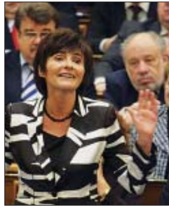
Lendvai Ildikó az MSZP frakcióvezetője hisz a csomag erejében...

2010-ben elmarad a családi pótlék emelése, összegét befagyasztják a jelenlegi szinten, és már csak 20 éves koráig kaphatja a gyermek, nem 23-ig. Mindez azt jelenti, hogy hiába tanul tovább a fiatal, a főiskolai évek alatt már nem számíthatnak a szülők segítségére. A gyerekeknevelés támogatása nagyon szűrja a szemét a jelenlegi kormánynak, eltökéltek a gyermekes családok megbüntetésében. Sólyom László köztársasági elnök is hiába dobta vissza a gyes megváltoztatásáról szóló törvényt, a kormánypárti honatyák szemrebbenés nélkül újra megszavazták,