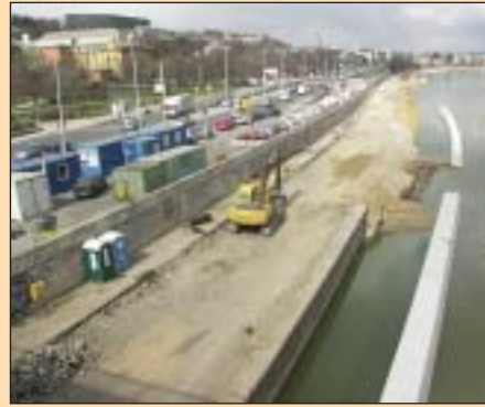
A budai alsó rakpart is járhatatlan

Sokak öröme vagy bánatára azonban ezúttal kevesebb lesz az útfelújítás Budapesten, mert most az évek óta halogatott, egyetlen „kapavágás” nélkül is egyre dráguló Margit-hídi felújításra kell a pénz. A munka várhatóan már júliusban elkezdődik, de csak augusztustól zárják le az autóforgalom elől az északi hídfélt - előrelátha-