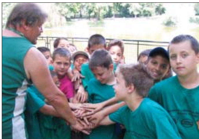
A foci-suli nyári napközis táborozó csapata harci kiáltással köszön az Orcy-parkban

Júliusban féláron bérelhetik a fővárosi családok a Margitszigeten a népszerű bringóhintót. A józsefvárosiak július 10-én élhetnek ezzel a lehetőséggel. Lakcímkártyájukat vigyék magukkal!