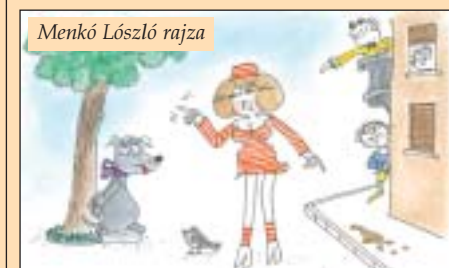
Menkó Lószló rajza