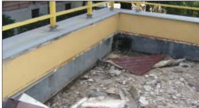
Szigetelik a Katica Bölcsőde teraszát

A Vajda Péter utcai Általános Iskolában a nagy területű sportudvar építésén túl a konyha is átalakításra kerül. A fényképen még a júliusi állapot látható, de augusztus végére mindenké-