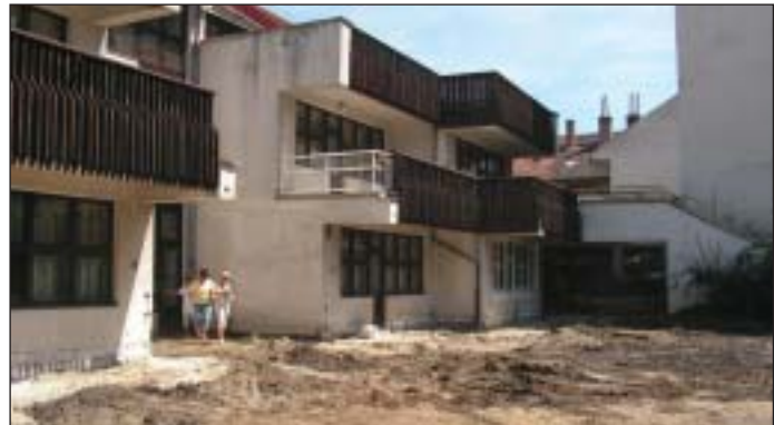
Itt lesz a Tolnai sportudvara