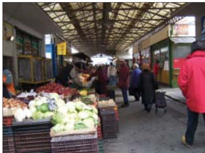
A tervek szerint pályázati pénzből újulhat meg a Teleki tér is