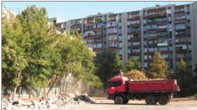
Sportudvart építenek a Vajdában