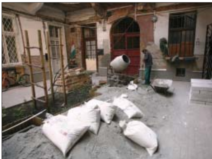
Lakóház-felújítás a Magdolna-negyedben