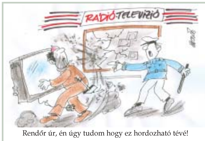
Rendőri úr, én úgy tudom hogy ez hordozható tévé!