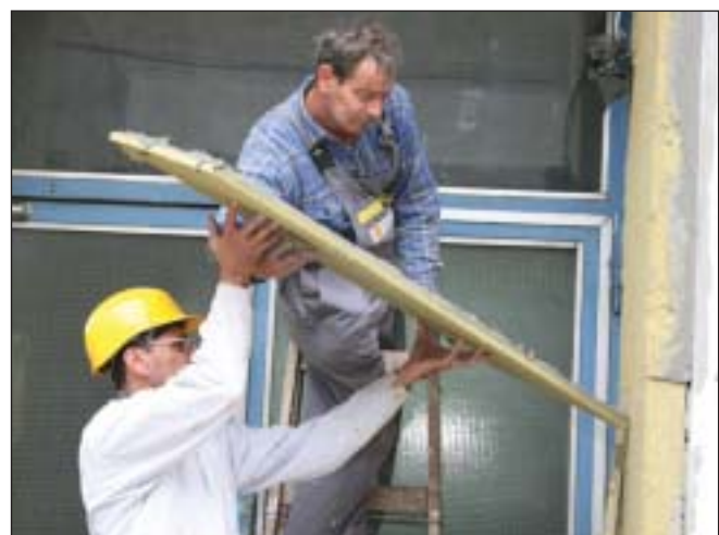
Szigetelik a panelházak homlokzatát a Baross utcában