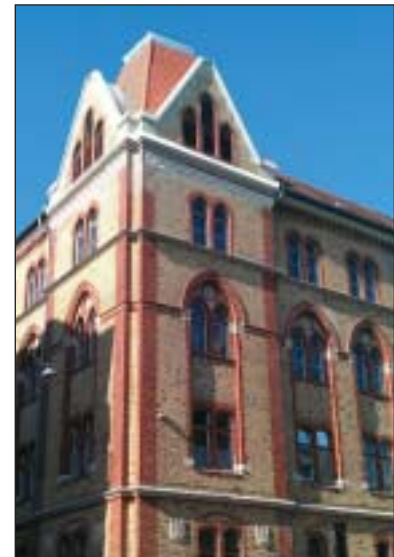
Felújították a Németh László Általános Iskola homlokzatát is.