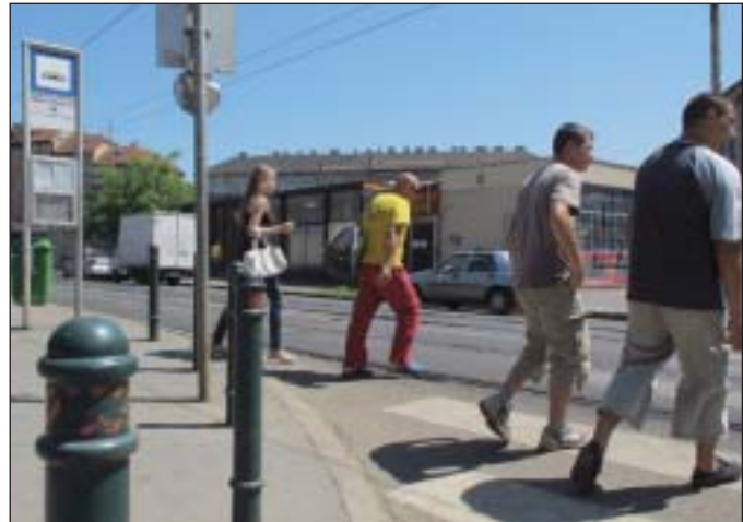
A régi piac már a múlté

– A közmondások igazságtartalmát nem vitatom. Ám az a több ló valójában csak egy: Józsefváros. Minden más feladatomban közben is az lebeg a szemem előtt, hogy hogyan is lehetne valamit tenni a kerületért. Van, ahol ez aligha kíván magyarázatot. Parlamenti képviselőm sok olyan ajtót nyit meg Józsefváros előtt, ami ha pusztán csak polgár-