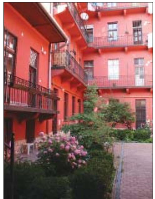
A Karácsony Sándor utca egyik felújított házának belső udvara