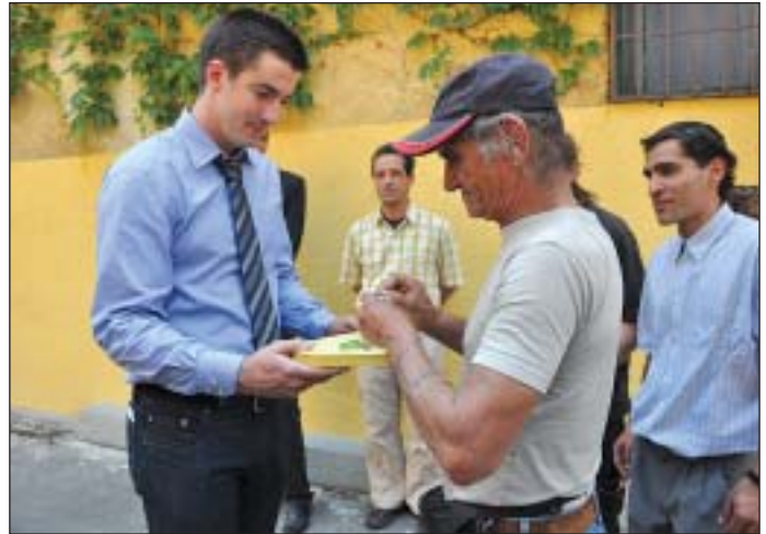
Kocsis Máté átadja a LÉLEK-program három résztvevőjének a saját használatú önkormányzati bérlakás kulcsát

Egy szoba, egy konyha és egy fürdőszoba - nem nagy dolog, sokak számára mégis csak álom. Évekig az volt annak a három férfinak is, akik tavaly decemberben hajléktalanként költöztek be a Koszorú utcai LÉLEK-házba, és akik június 8-án már saját használatú, önkormányzati tulajdonú, felújított bérlakásokat vehettek birtokukba. A három egykori hajléktalan mára munkával rendelkezik, és összegyűjtötték az újrakezdéshez legelő pénzüsszeget is.