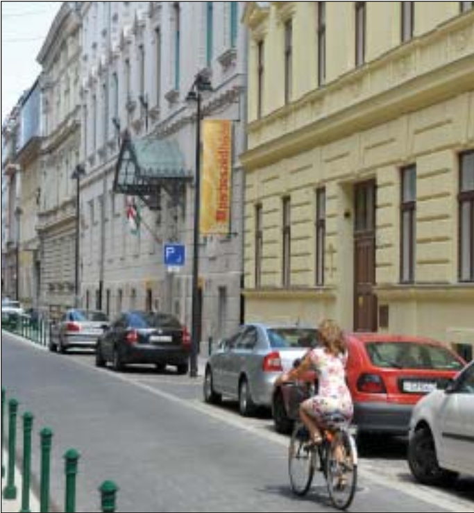
A „faltól falig” utcák tágasabbak lettek, és csillapult a forgalmuk

nyílik meg a teljes pincerészt magában foglaló 300 férőhelyes multifunkcionális nagyterem, színpaddal, mellékhelyiségekkel, a fellépőknek szánt öltözőkkel.