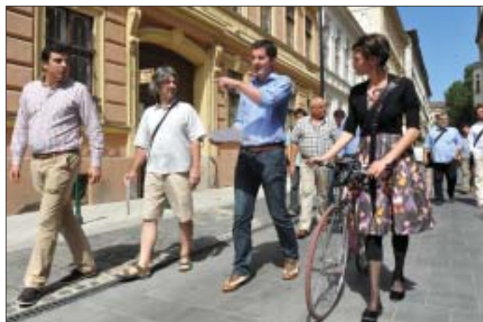
A programzáró séta: Kocsis Máté polgármester a CaPe és a negyed önkormányzati képviselőjével, háttérben a tervezőkkel

rel elelőtt az „Európa Belvárosa” programot. A tervezés a Rév8 Zrt. feladata volt, amely hat lakossági fórumon vitatta meg a közterületi fejlesztéseket. A helyiek véleményét számításba véve határozták meg az