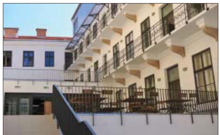
Az átalakult Horánszky utca 13. – Az udvar alatti lejárát a nagyterembe vezet

A pályázat határidejének megfelelően 2012. augusztus 12-én lezárult az Európa Belvárosa program. Kocsis Máté polgármester leginkább az új közösségi háznak örül, amely nagy álma volt. Most a pincétől a padlásig végigjárta. Az épület az átépítésnek köszönhetően az eredeti hasznos alapterületének kétszeresére nőtt, így 1500 négyzetméteres lett. Az utca felől nézve továbbra is kétemeletes, de az udvari részre felhúztak még egy szintet. A földszintet az udvar felé megnövelve tágas fogaadóter jött létre. Az udvar hátsó része nyitott maradt, alatta