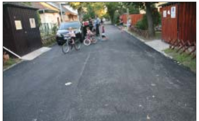
A Strázsa utca megújult burkolata a csapadékvíz-elvezetés biztosításával

A felajánlásnak köszönhetően a Strázsa utca 573 m 2 felületen új aszfalt-kiegyenlítő és kopóréteget kapott, a meglévő aknafedlapok egy szintbe kerültek, és biztosították a megfelelő csapadékvíz-elvezetést is. A munkát augusztus 28-án a Felajánló befejezte.