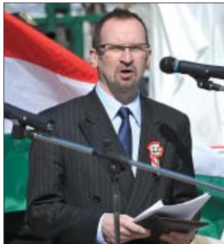
Kocsis Máté polgármester és Szájer József a Fidesz európai parlamenti képviselője

Mert egy szobor memento is egyben, egy intés, egy figyelmeztetés az utókornak”.