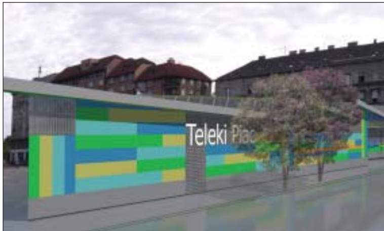
Ilyen lesz az új piac a Teleki téren

Az előzetes egyeztetéseket, az irodai munkát és a közbeszerzési eljárást követően nyár végén megkezdődhet a Teleki téri piac építése. A régi piac helyén lévő telket két részre osztotta az önkormányzat, így egyik felén az Új Teleki téri piac épül meg, míg mellette, a telek másik felén a LIDL Magyarország építi fel új üzletét. A cég munkagépei a napokban felvonták az építési területre és az épület felhúzása ezzel elkezdődött.