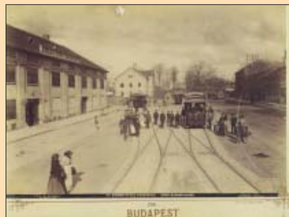
A régi Baross utca

A tervek között hat útszakasz szerepel, ezek közül a leghosszabb szakasz Józsefvároson át húzódik. A tervek szerint archív fotókkal fednék el a Rákóczi út két oldalán található üres üzleteket az Astoria és a Blaha Lujza tér között, illetve a József körút két oldalán, a Blaha Lujza tér és a Rákóczi tér között, de a helyszínek között van a József körút két oldala is a Rákóczi tértől egészen a Corvin negyedig. Ezekon a helyszíneken kívül még szerepel a Kossuth Lajos utca két oldala a Ferenciek tere és az Astoria között, valamint a Ferenc körút két oldala a Corvin negyedtől a Boráros térig.