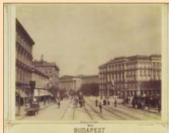
A Kálvoin tér egykor

A mintaprojekttel a Főváros célja, hogy a bezárt boltok kirakataira az adott helyszínt ábrázoló archív felvétel vagy képzőművészeti alkotást ábrázoló kép kerüljön – ezzel is segítve, hogy egységes és rendezettebb képet mutassanak. Az üres üzletek közös logót is kapnak, jelezve, hogy az érintett ingatlanok kiadásra várnak, sőt feltüntetik a szükséges elérhetőségeket is. Kocsis Máté, a kerület polgármestere korábban úgy nyilatkozott, nagyon örül a kezdeményezésnek és támogatja azt.