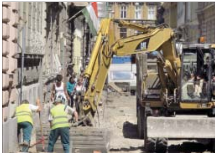
A Horánszky utca felújítása is zajlik

Lassan a végéhez közeledik az Európa Belvárosa Program. 2010 elejétől folyamatos átalakuláson ment keresztül a Palotanegyed. Első lépésként megújult a Mária utca, majd sétáló utcává alakult a Gyulai Pál utca egy része. Átépült a Kőfaragó utca, és a megszüpült Gutenberg teret is hamarosan birtokba veheti a lakosság. A beruházás a Horánszky utca átépítésével fejeződik be, ami április hónapban megkezdődött. A beruházás eredményeként