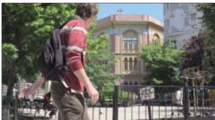
A megszüpült Kőfaragó utca és a Gutenberg tér