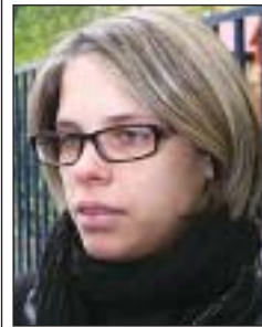
Kolop Vanda kismama

A játszótéren nem tapasztaltam ezt, mióta őrszolgálat vigyáz a biztonságra, de lépcsőházakban már én is találkoztam eldobott tűkkel, sőt többször láttam is, amint éppen belövik magukat. Szerintem nem fog változni a helyzet, meg fogják oldani, hogy tűhöz jussanak. Éjszakánként megy itt a hangoskodás, sajnos pont az óvoda és a bölcsőde környékén. Nem tudom, hogy mennyire szorult vissza a hepatitis-megbetegedések gyakorisága a drogosok között a program elindulása óta, de én jobban féltém a gyerekeket a járványtól.