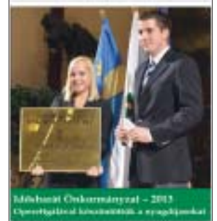
Létfennmaradási Józsefvárosnak. A legjobbak között a kerület