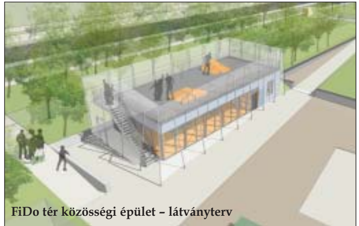
FiDo tér közösségi épület – látványterv

Előző számunkban hírt adtunk róla, hogy az önkormányzat 3,8 milliárd forintot nyert területfejlesztésre, így útnak indul a Magdolna Negyed Program harmadik szakasza. Nemcsak épületek és közterek újulnak meg, de a negyedben lakó, nehéz szociális helyzetben élőknek is segítséget nyújt a program. Balogh István Szilveszterrel, a negyed önkormányzati képviselőjével a megvalósuló szociális kiegészítő programokról beszélgettünk. A képviselő kiemelte, hogy a Magdolna negyed felújítása évtizedes terheket vesz le Józsefváros válláról.