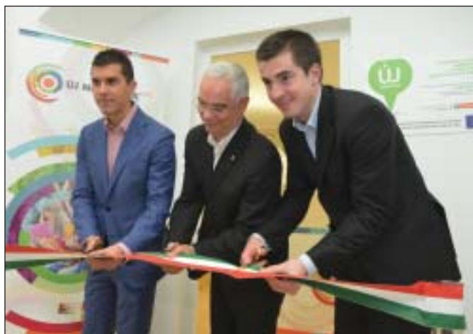
Mihalovics Péter miniszteri biztos, Balog Zoltán, az emberi erőforrások minisztere és Kocsis Máté, Józsefváros polgármestere

Mihalovics Péter, az új nemzedék jövőjéért felelős miniszteri biztos arról szólt, hogy az elmúlt két évtized legnagyobb ifjúsági fejlesztése valósulhat meg. A program fontos elemeként a szolgáltatások bővítését emelte ki, hogy az élet teljes területén tudjanak tanácsokkal szolgálni a fiataloknak, megkönnyítve a tanulás utáni önálló életkezdést. Az irodákban négy fiatal tanácsadó várja majd a diákokat, hallgató-