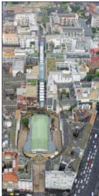
Az új városnegyed

A városnegyed-felújítási programmal Józsefváros régi rossz hírét sikerült megváltoztatni. Az egész városrész megítélését, gazdasági vonzerejét jelentősen javítja.