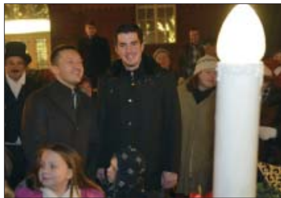
Rogán Antal, a Belváros és Kocsis Máté, Józsefváros polgármestere az adventi gyertyagyújtáskor