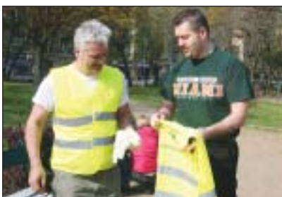
A képviselők mellett a rendőrkapitány is segítette a munkát