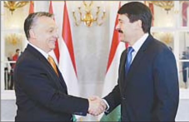
Orbán Viktor miniszterelnök elfogadta Áder János köztársasági elnök felkérését a kormányalakításra

Az április 6-i választások eredményeként Orbán Viktor, a Fidesz elnöke alakíthat kormányt. Az új kormány létrejöttéig ügyvezető kormányként működik az eddigi. Az Országgyűlés május 6-án alakul meg.