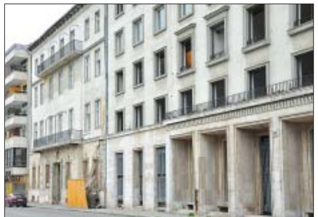
Szomorú mementók: a II. János Pál pápa tér (az egykori Köztársaság tér) 26. és 27. számú házai

2009 januárjában jelképes kulcsátadással nyitották meg új székházukat a szocialisták a VI. kerületi Jókai utcában. Az egykori szakszervezeti épület körülbelül bruttó 700 millió forintért vásárolták meg, majd alaposan felújították. Az is jelképes, hogy a kulcsot Simon Gábor, az MSZP választmányának elnöke adta át Gyurcsány Ferenc pártelnöknek. Simon ma előzetes letartó-