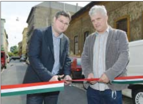
Sára Botond alpolgármester és Kaiser József képviselő vágta át a szalagot

A Magdolna Negyed Program III. üteme 12 ezer embert érint közvetve. Megvalósítására 3,8 milliárd forint támogatást nyert Józsefváros önkormányzata az Új Széchenyi Tervből. Ezzel az összeggel Józsefváros a főváros legeredményesebben pályázó kerülete lett ebben az önkormányzati ciklusban.