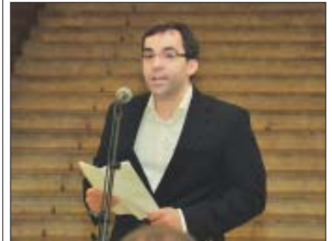
Egry Attila alpolgármester

Egry Attila, Józsefváros alpolgármestere kifejtette, a kerület vezetése azon dolgozik, hogy a zöld területek bővítésével, a terek, parkok, padok felújításával javítsa a köz-tisztaságot és védje a környezetet. Hozzátette, az önkormányzat az idén meghirdeti a legvirágosabb társasház pályázatot, vala-