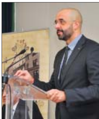
Kovács Zoltán államtitkár

Az országgyűlési választáson történelmi győzelmet aratott a Fidesz-KDNP, de nem szabad hátradólni. A cél, hogy a május 25-ei választáson is minél több Magyarországot és a határon túli magyar érdekekért kiálló képviselő kerüljön az Európai Parlamentbe – mondta Kovács Zoltán államtitkár. Az Emberi Erőforrások Minisztériumának társadalmi felzárkóztatásért felelős államtitkára a Polgárok Házában tartott előadást.