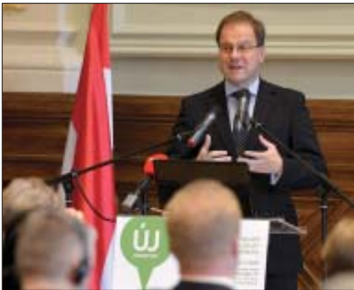
Navracsics Tibor miniszterelnök-helyettes

Az európai parlamenti (EP-) választás kampányában elhangzó szlogenek két végpont köré csoportosíthatók: az egyik, hogy legyen Európai Egyesült Államok, a nemzeti érdek oldódjon föl egy nemzetek fölötti, európai érdekekben, a másik, hogy lépünk ki az Európai Unióból, mert a nemzeti érdeket csak az EU-n kívül lehet képviselni. Mindkét jelszó ugyanaból a tévedésből fakad, hogy az Európai Unió ellentétes a nemzeti érdekekkel – mondta Navracsics Tibor csütörtökön, a magyar uniós tagság tíz évéről rendezett konferencián. „Szerintem úgy gondolom, hogy részben az európai integráció története, részben pedig a magyar történelem is azt támasztja alá, hogy ezzel a közös tőről fakadó két tévedéssel szemben a magyar európai uni-