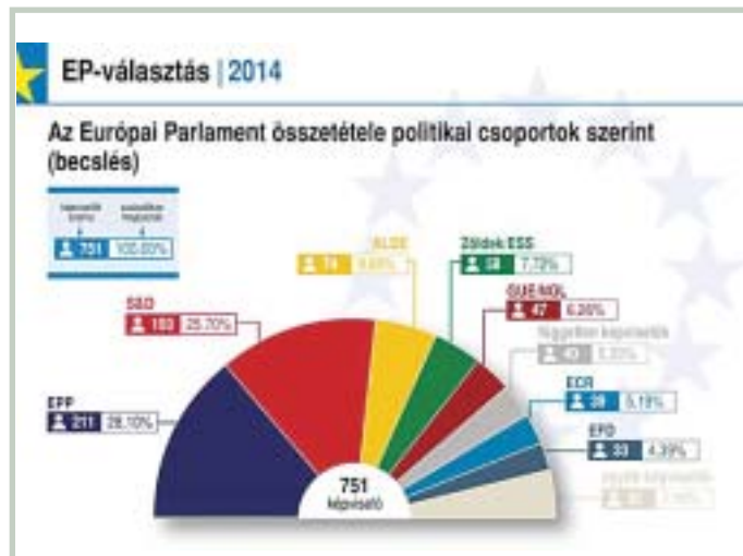
Az Európai Parlamentben az Európai Néppárt (EPP) alkotja a legnagyobb frakciót, melynek a Fidesz-KDNP képviselők is a tagjai

A vasárnap tartott európai parlamenti választásokon a Fidesz-KDNP a szavazatok 51,49 százalékát kapta, amellyel megszerezte az abszolút többséget, ezáltal 12 képviselője lesz Brüsszelben. A kormánypártok adják a legnagyobb magyar képviselőcsoportot az Európai Parlamentben. A második legerősebb párt a választási adatok szerint a Jobbik lett, a radikálisok 14,68 százalékot szereztek, hárman fogják képviselni a pártot az Unióban. Látványosan hanyatlak az MSZP, amely bár országos szinten még a 3. legerősebb párt 10,92 százalékos eredménnyel, de már több helyen megelőzi őket a Demokratikus Koalíció és