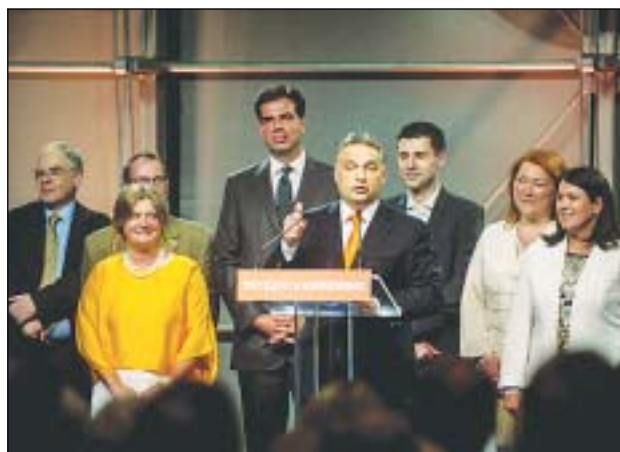
Orbán Viktor a Fidesz-KDNP EP-képviselőivel

Győztünk, nagyon győztünk, sőt mi győztünk a legjobban! – értékelte Orbán Viktor miniszterelnök, a Fidesz elnöke vasárnap este a Fidesz-KDNP európai parlamenti választási győzelmét. A kormánypártok eredményváró rendezvényén, a budai Millenáris Parkban összegyűlt szimpatizánsok előtt szónokolva a miniszterelnök felhívta a figyelmet arra, hogy az Európai Néppárt tagjai közül a Fidesz-KDNP érte el a legjobb eredményt, vagyis arányaiban ez a pártszövetség járult hozzá a legjobban a Néppárt győzelméhez.