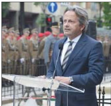
Vargha Tamás honvédelmi államtitkár

Az ünnepi műsor keretében elhangzott a 32-es baka vagyok én című ismert katonanóta, és az egyházi felekezetek (katolikus, evangélikus, izraelita) is megemlékeztek és áldást kértek a hős magyar katonákra.