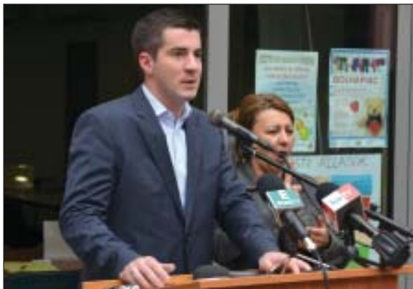
Kocsis Máté nyitotta meg a tavaszi állásbörzét

Immár ötödik éve rendezik meg Józsefvárosban a kerületi állásbörzét és karriernapot. A mostani eseményt az különbözteti meg az eddigiektől, hogy eddig soha nem látott számban jelentek meg a munkát kínáló cégek, vállalatok: összesen 66 munkáltató kínálta 1651 állásajánlatát a Kesztyűgyár Közösségi Házban. Kocsis Máté polgármester megnyitójában különleges alkalomnak nevezte a tavaszi állásbörzét, hiszen ritkán fordul az elő, hogy jóval kevesebb az állásbörzéken a megjelentek egyharmada munkalehetőséget kapott.