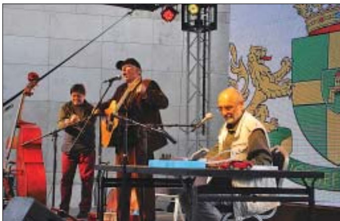
A Kaláka együttes nagyszerű koncertet adott

Rengeteg program és még annál is több vidám gyermekarc töltötte be június elsején, vasárnap a megszépült II. János Pál pápa teret. Gyönyörű környezetben több száz család töltötte a – szerencsére szinte esőmentes, napsütéses – szabadidejét a részben Józsefváros Önkormányzata szervezte Bóbita Családi Napon. Nagyszerű koncertek, gyermekelőadások, kreatív sarkok, gólyalások és sok egyéb más várta a kicsiket és nagyokat.