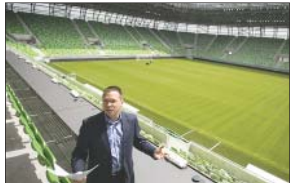
Fürjes Balázs kormánybiztos a modern technológiával felépült ferencvárosi stadionban

Fürjes Balázs szerint átlagosan 15 ezer fős nézőszám várható a stadionban, amely nemzetközi mérkőzéseken 23 500, a magyar bajnoki találkozókra pedig több mint 24 ezer drukker befogadására lesz alkalmas. A kormánybiztos azt mondta, az új Puskás Ferenc Stadion felépítéséig válogatott összecsapásokat is rendeznek majd az arénában, amelyben évente legalább 200 rendezvénynapot szeretnének tartani az évi 30-50 futballmérkőzésen kívül.