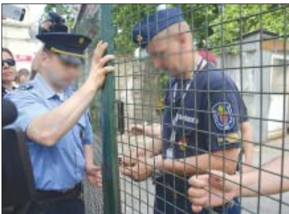
Lakat került a kétes hírű piac kapujára

reült piacot. A területen már nem tartózkodott senki, így a rendőrség és a sajtó munkatársai, térdig gázolva a szemétkben, gyorsan bejárták a volt piacot, amit a MÁV birtokba vett. A végleges kiürítést, és a maradék bódék lebontását a vasúttársaság fogja befejezni. Az átadáson a piacot üzemeltető Komondor Kft. képviselője a