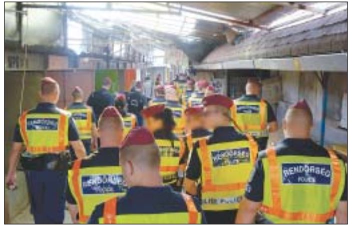
Több tucat rendőr biztosította a végrehajtást

Nem csak egy modern európai nagyvárosához volt méltatlan a piac, de a bűnözés melegágya is volt. Bűncselekmények elkövetése szempontjából Budapest egyik gócpontjaként tartották számon. „A józsefvárosi piacon a kispénzű vásárlók nem voltak biztonságban, átverték és becsapták őket; számos bűncselekményt követtek el ott, ezért kezdeményezte a tulajdonosoknál (MÁV-nál és a Nemzeti