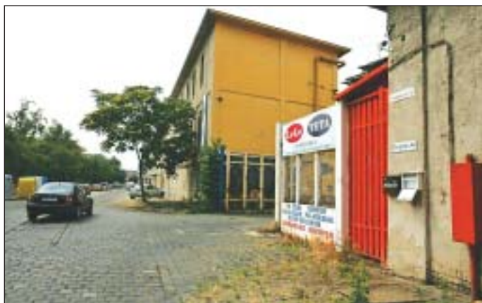
Kétirányú lesz a Golgota utca a Ganz-kapuiig

Józsefváros Önkormányzatának Városgazdálkodási és Pénzügyi Bizottsága júniusi ülésén döntött a Golgota utca forgalmi rendjének megváltoztatásáról. Ugyanis több lakossági panasz érkezett az önkormányzathoz azzal kapcsolatban, hogy óriási az áthaladó forgalom a Kolónia lakótömb (Delej utca, Golgota utca, Bláthy Ottó utca, Vajda Péter utca által határolt terület) közvetlen környezetében. A Ganz gyártelepre ügyevők eddig a Vajda Péter